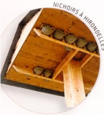
NICHOIRS À HIRONDELLES