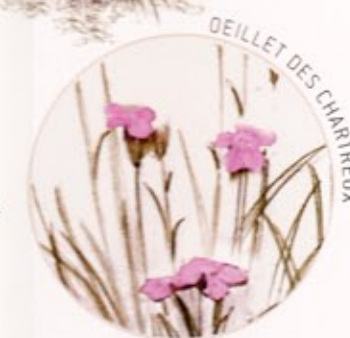
OEILLET DES CHARREUX