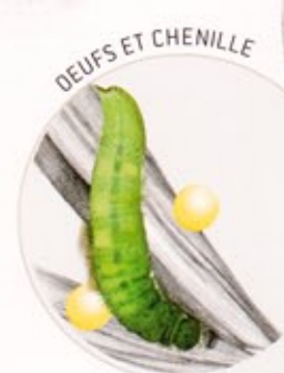
DEUFS ET CHENILLE