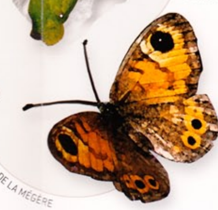
CYCLE DE VIE DE LA MÈGÈRE