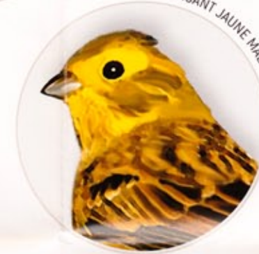
BRUANT JAUNE MÂLE

La partie centrale de l'aire de repos est dévolue à la biodiversité. Des habitats naturels marginaux, devenus rares dans nos paysages, y ont été aménagés. Bandes de hautes herbes richement fleuries, buissons indigènes, végétation clairsemée sur sol caillouteux, tas de pierres, souches et gouilles se partagent cette surface. Des nichoirs à oiseaux et à insectes ont également été mis en place avec le soutien de sociétés régionales de protection de la nature. Tous ces habitats ne nécessitent qu'un entretien modeste, mais ils sont pleins de vie. Laissez votre regard et votre oreille repérer fleurs, papillons, lézards et oiseaux !