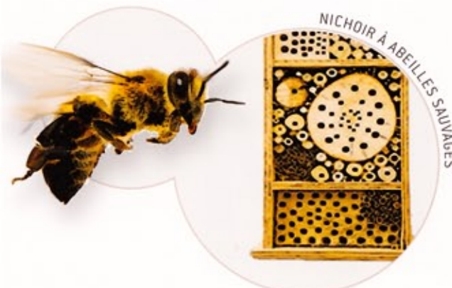
NICHOIR À ABEILLES SAUVAGES

La mise en mosaïque des différents habitats augmente encore la biodiversité. Ainsi, un papillon comme la Mégère se nourrit sur les fleurs des herbages et des buissons, s'abreuve dans les gouilles et trouve de précieux sels minéraux sur les cailloux ; l'adulte pond ses œufs sur les hautes herbes dont se nourrira la chenille ; celle-ci se dissimulera sur une vieille souche ou entre deux pierres pour que la chrysalide soit protégée au moment de se métamorphoser à son tour en adulte.